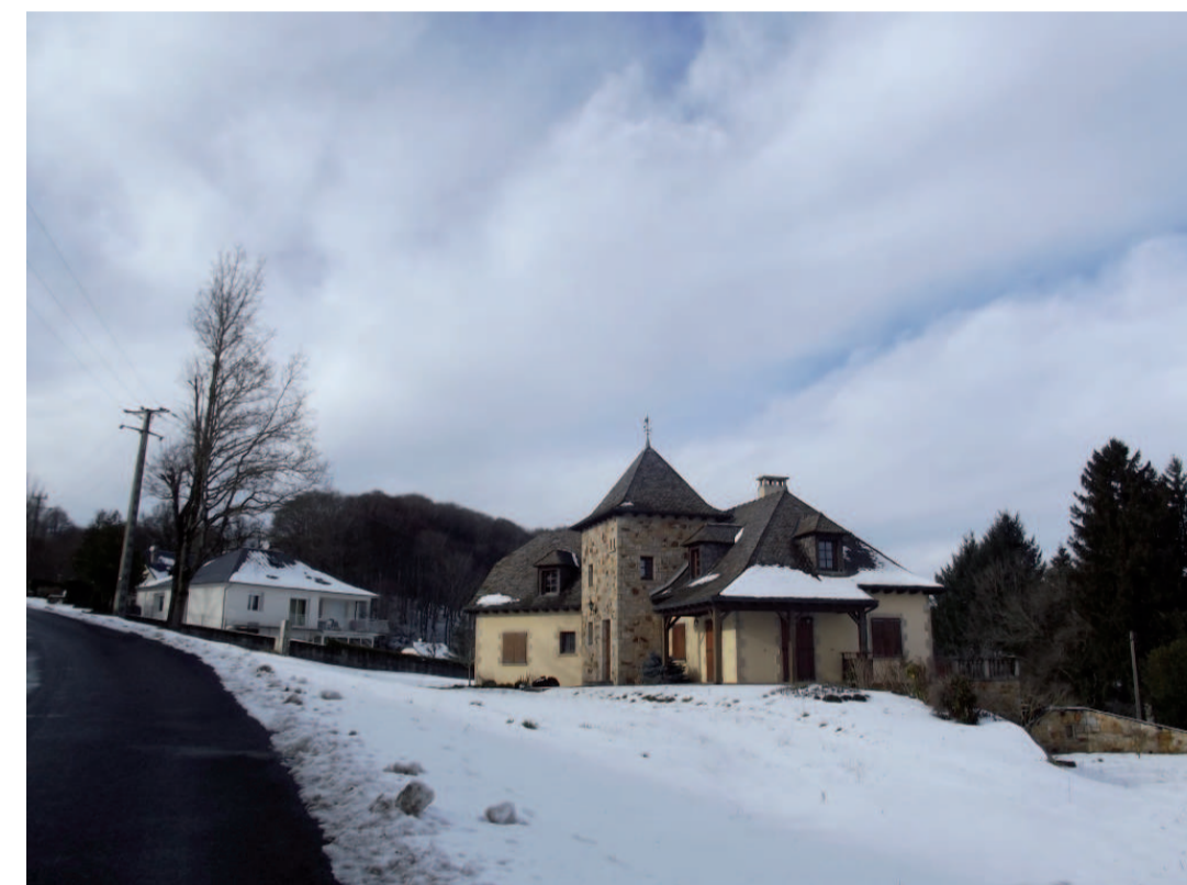
Architecture très différente au sein du même flot - Lotissement Le Mayrac