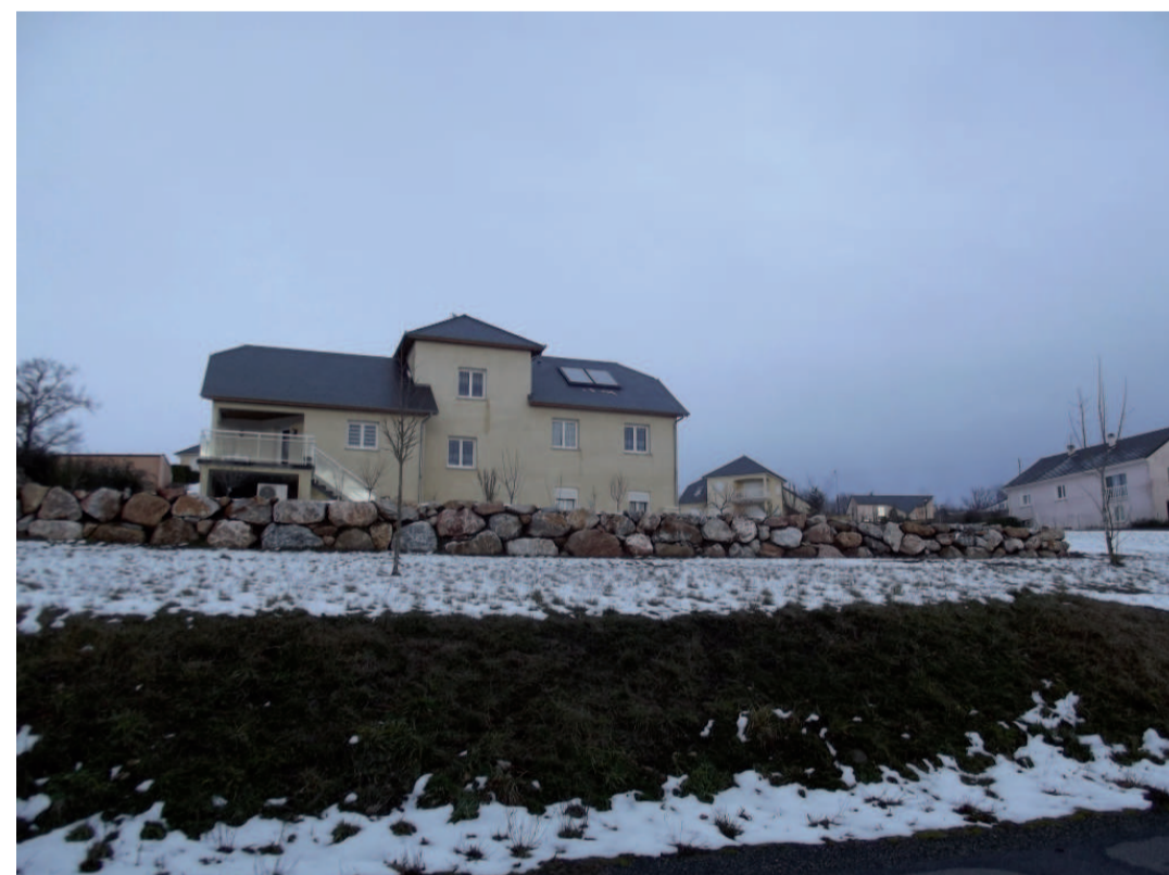
Enrochements - Lotissement du Théron